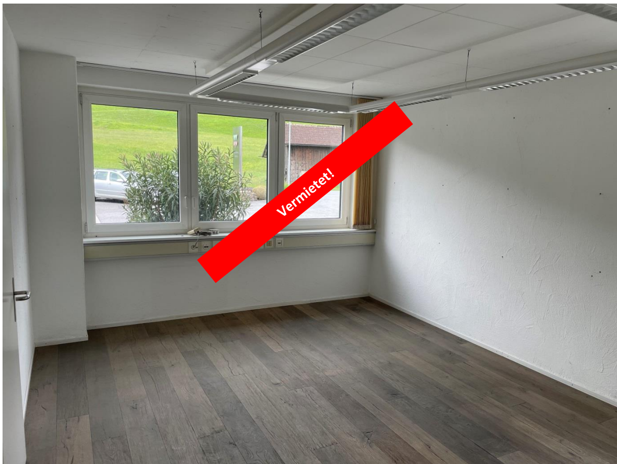
Eck-Büro Nord mit direktem Zugang. Eichenholzboden